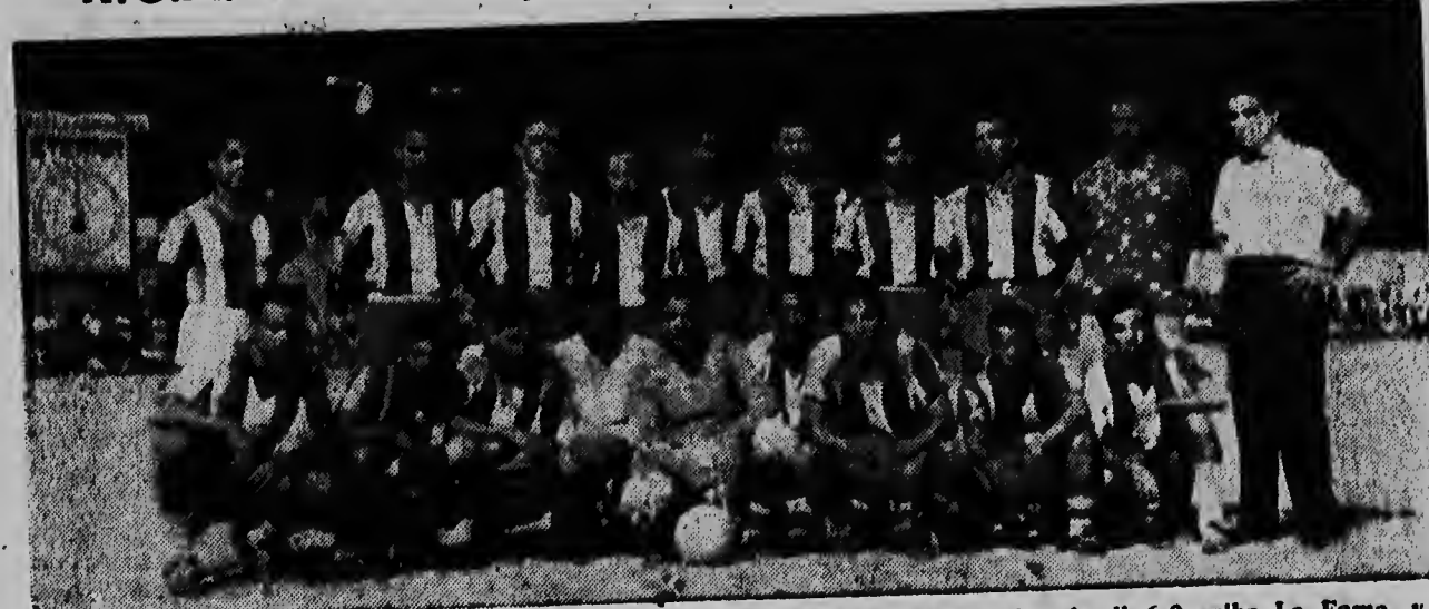
Esaki ta un foto di e hungadornan di R.C.A. cu ayera nochi a obtene facilmente victoria di 6-0 ariba La Fama, y cu esel tambe a bira Campeon den Hoofdklasse di Competitieve 1956. Na halftime e score tabata 1-0. Durante di henter e partido R.C.A. tabata domina e wega den presencia di hopi publico. Nos mas calurosos felicitaciones na R.C.A. pa nan reconquista di e titulo di Campeon.

Het is ons een eer langs deze weg het publiek in het algemeen en onze geachte clientèle in het bijzonder uit te nodigen onze nieuwe zaken aan de Adriaan Laclé boulevard- hoek Nassaustraat te komen bezichtigen op